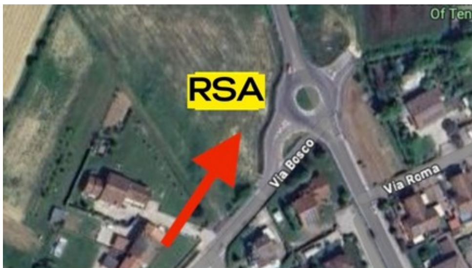
Vista aerea

Riportiamo degli estratti di mappa e delle simulazioni affinché possiate avere contezza dell'impatto della Variante 16 - RIF. RSA a FOSSONA